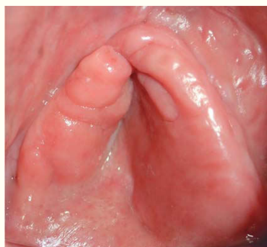
Figura 4. Aspecto intraoral maxilar superior.