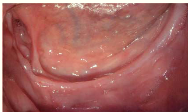
Figura 3. Aspecto intraoral maxilar inferior.