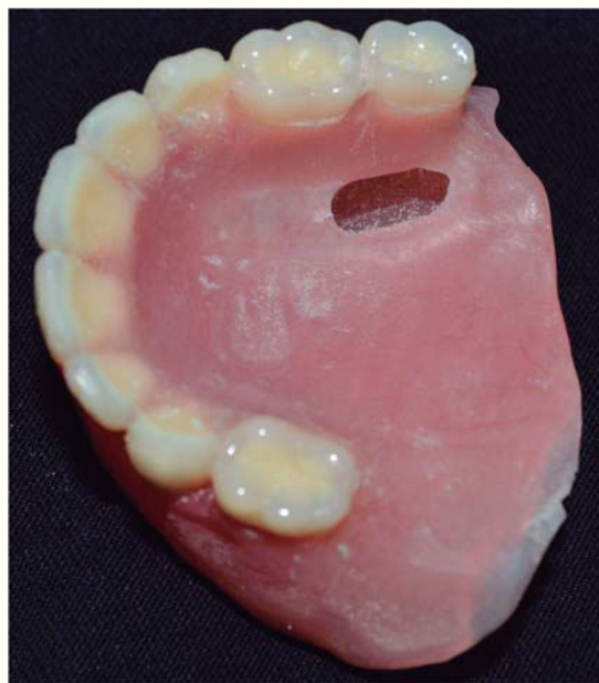
Figura 5. Prótesis superior ahuecada.

Se realizaron algunos ajustes selectivos con ayuda de papel de articular (Progress 100®, Bausch).