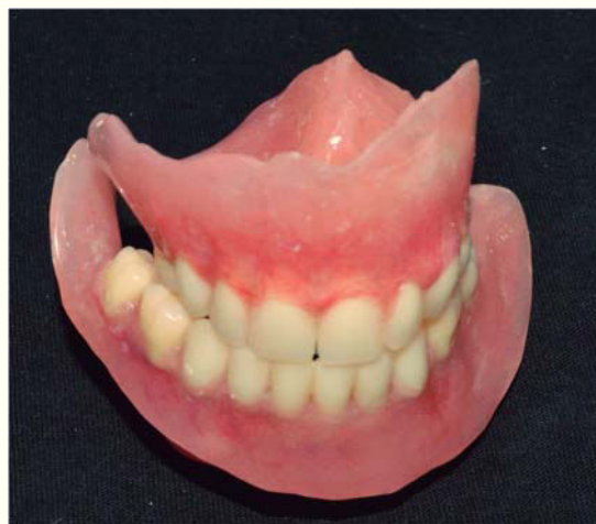
Figura 6. Prótesis recortadas y pulidas.