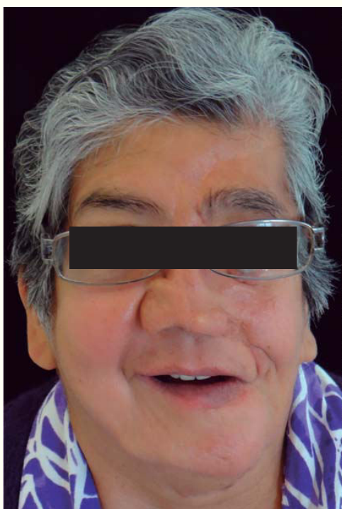
Figura 7. Aspecto con la prótesis.

El seguimiento de la paciente al mes, seis meses y un año, nos ha indicado que la prótesis ha sido cómoda y funcional (Figura 7).