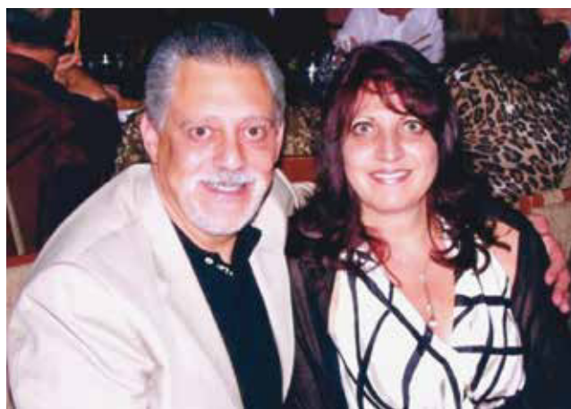
Figura 3 Último congreso en Cancún de la SMU.