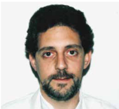
Figura 2 En León, durante su residencia en el Centro Médico “20 de Noviembre” del ISSSTE.