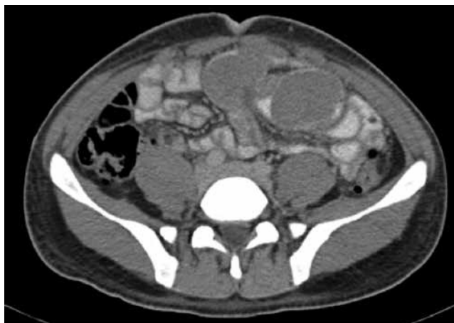
Figura 2 TAC abdominal contrastada, donde se aprecian imágenes ovoideas intraluminales en íleon distal.

Las metástasis de teratoma maduro pueden convertirse a diversas histologías, siendo algunas de las reportadas