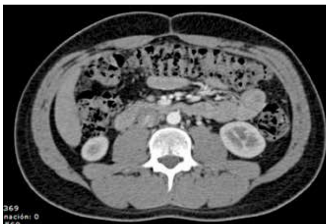
Figura 3 TAC abdominal con medio contraste, donde se identifica ganglio en retroperitoneo de aproximadamente 1 cm.

adenocarcinoma, rabdomiosarcoma o tumor neuroectodérmico. Las metástasis a intestino delgado de tumores germinales testiculares son raras, sin reportarse hasta el momento un porcentaje. Dentro de sus manifestaciones posibles se encuentra la oclusión intestinal y el sangrado de tubo digestivo, requiriendo manejo quirúrgico en la mayoría de las ocasiones. La histología más frecuente en estos casos es tumor germinal mixto. Sin embargo, la transformación a coriocarcinoma no ha sido reportada. Por esta razón, en los pacientes con tumores de células germinales con metástasis intestinal, es necesario el diagnóstico y tratamiento temprano y oportuno. Así, quienes se conocen con diagnóstico de cáncer testicular, especialmente aquellos con características histológicas al coriocarcinoma y que involucran al tracto digestivo, se consideran como enfermedad avanzada, pues casos reportados han recibido quimioterapia por presentar metástasis en otros sitios en el mismo momento. Algunos estudios de imagen convencional no muestran masas metastásicas ocultas, por lo que la sintomatología como náusea, vómito, dolor abdominal o sangrado de tubo