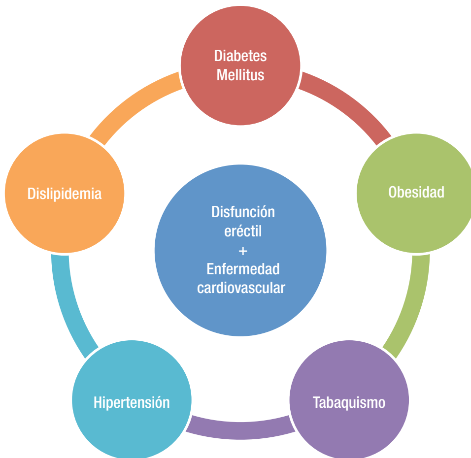
Figura 1. Factores de riesgo cardiovascular asociados a disfunción eréctil. Los factores de riesgo cardiovascular que han demostrado una asociación directa con disfunción eréctil en distintos ensayos clínicos son: diabetes mellitus, obesidad, tabaquismo, hipertensión y dislipidemia.

aguda, que desencadena los eventos cardiovasculares agudos. 13 Este crecimiento crónico de la placa permite una dilatación de la pared del vaso de hasta un 40%, pero una vez alcanzado este, la placa comienza a obstruir el flujo sanguíneo, dando inicio a la última fase de la aterosclerosis. Esta etapa es caracterizada por cambios y síntomas clínicos compatibles con obstrucción vascular.