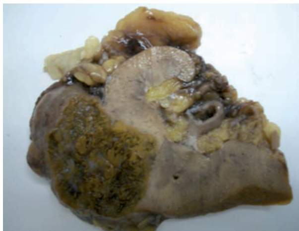
Imagen 2. Pieza macroscópica, con corte sagital, previa preparación para estudio histopatológico. Se aprecia lesión en borde externo y medial del riñón afectado.

Si bien los oncocitomas renales son neoplasias raras, cada vez se están informando más en la literatura médica, básicamente porque en la medida en que son mejor conocidos tanto por clínicos como por patólogos se han ido diferenciando del carcinoma de células renales que como hemos insistido pueden ser fácilmente confundidos por unos y por otros.