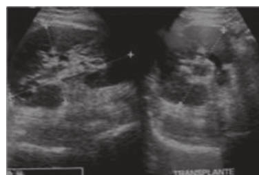
Imagen 3. Ultrasonograma

Con estos estudios se concluyó diagnóstico de linfocele gigante y se propuso la realización de laparoscopia, a la que el paciente se negó. Por ello, se le propuso la punción, drenaje y esclerosis de la cavidad con alcohol total vía percutánea guiada por imágenes. El procedimiento se realizó en forma ambulatoria, drenándose aproximadamente 1200 mL de líquido seroso. Se utilizaron 200 mL de alcohol que se dejó media hora dentro de la cavidad, permaneció con sonda de drenaje por espacio de 10 días y se retiró al comprobar gasto escaso. Posterior al procedimiento, los azoados disminuyeron a niveles normales, se comprobó mediante ultrasonido el injerto renal sin dilatación y ausencia de linfocele. El resultado citopatológico del líquido del linfocele informó: material proteínico con un componente celular inflamatorio y linfocitario abundante .