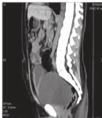
Imagen 5. TC.