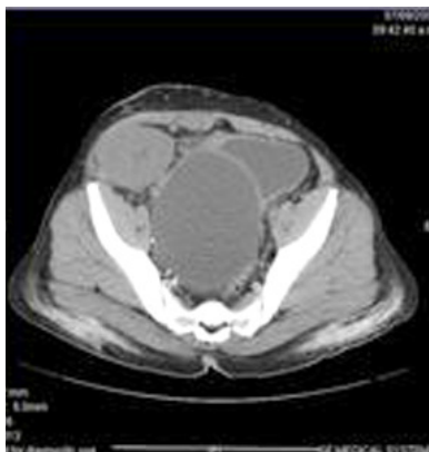
Imagen 4. TC