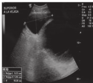
Imagen 2. Ultrasonograma.