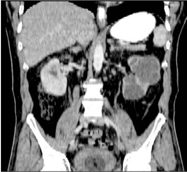
Imagen 1. TAC contrastado donde se observa riñón izquierdo con poliquistosis y pérdida de su anatomía y lesión hipodensa en riñón derecho (flecha).