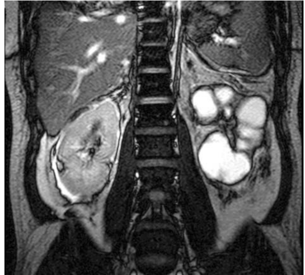
Imagen 2. RMN sin evidencia de lesión en riñón derecho. Se observan las lesiones quísticas de riñón izquierdo.