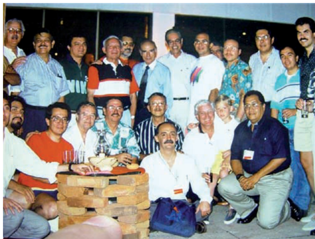
Con colegas urólogos en reunión de la SMU.