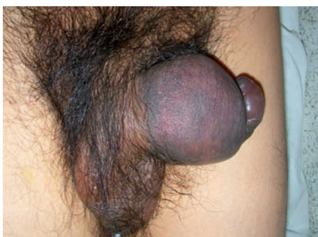
Imagen 1. Hematoma derecho que desvía el pene hacia la izquierda.