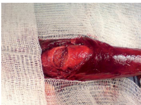
Imagen 2. Lesión unilateral de 2.5 cm.

capacidad. En su estado flácido tiene un grosor aproximado de 2.4 mm y en erección de 0.25 a 0.5 mm. El diagnóstico es clínico. El uso del ultrasonido tiene poca sensibilidad para mostrar su discontinuidad. Ante la sospecha de lesión uretral se requiere cistouretrografía. Al tratamiento conservador se atribuye hasta 40% de las complicaciones, con desviación del pene y disfunción eréctil. 7 El compromiso de la vena dorsal puede simular una fractura del cuerpo cavernoso al provocar un hematoma considerable y la desviación del órgano. Aún es controversial el tipo de incisión practicada en la reconstrucción; la más recomendada es la circunferencial