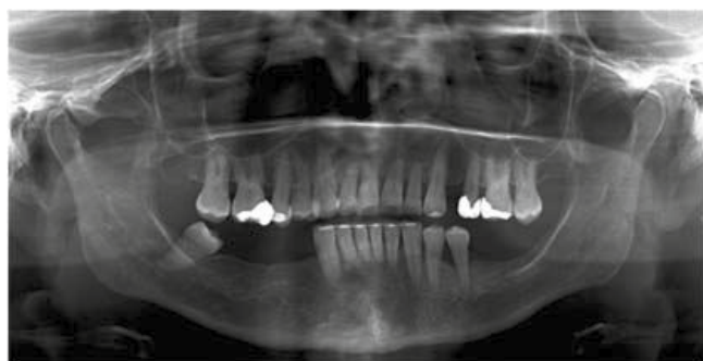
Figura 9. Radiografía panorámica final.

tamiento tanto faciales como dentales: se mejoró el perfil facial blando debido a que se redujo la biproque- lia y aumentó el ángulo nasolabial de 61° a 80°.