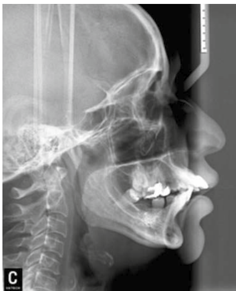
Figura 3. Radiografía lateral de cráneo inicial.