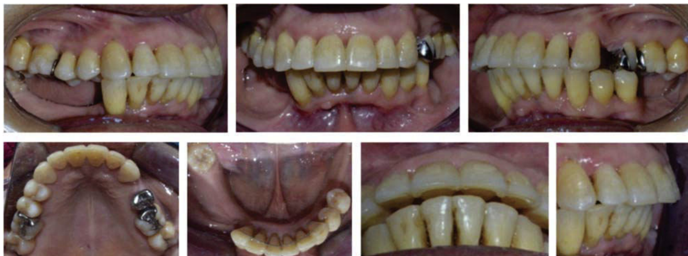
Figura 6. Fotografías intraorales finales.

En la arcada inferior se colocó retenedor fijo de canino a canino con alambre trenzado 0.175" y en superior se colocó un retenedor removible circunferencial ( Figuras 5 y 6 ). La paciente fue remitida al Departamento de Prótesis Bucal e Implantología de la Facultad de Odontología de la UNAM para la rehabilitación.