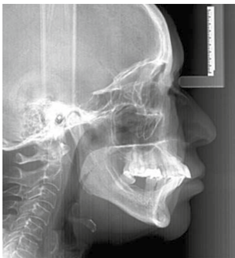
Figura 8. Radiografía lateral de cráneo final.

Al finalizar el tratamiento realizado durante 23 meses, los resultados obtenidos fueron satisfactorios. Se consiguieron los objetivos planteados al inicio del tra-