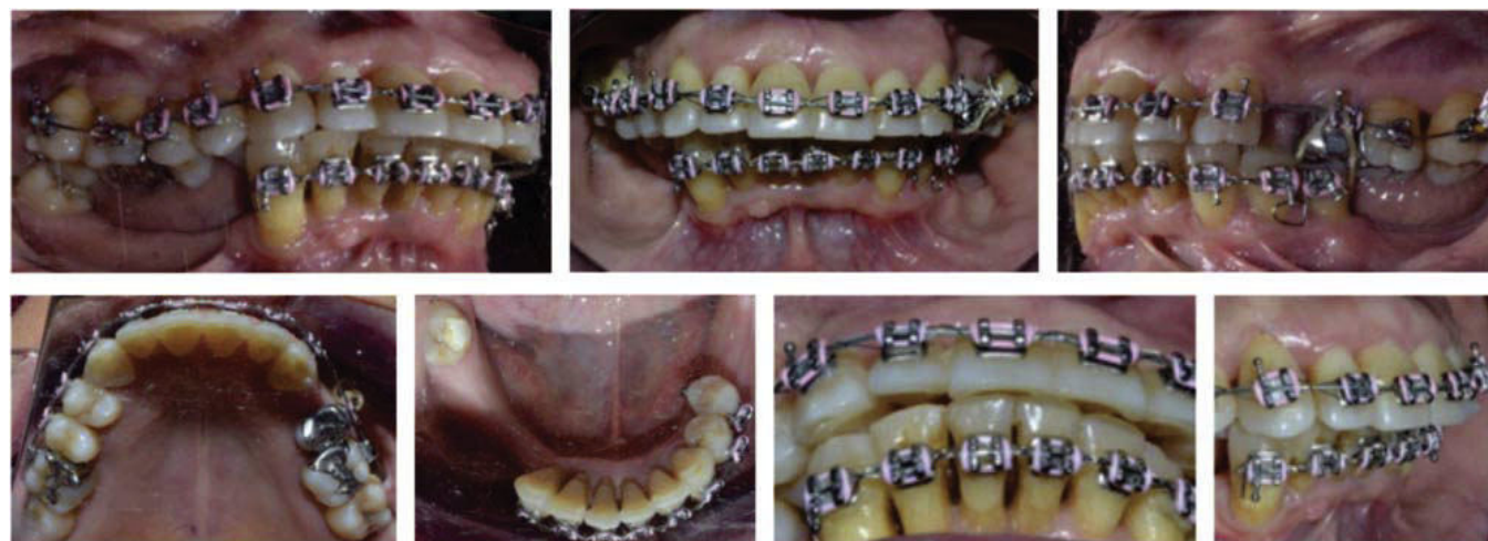
Figura 5. Fotografías intraorales de avance.