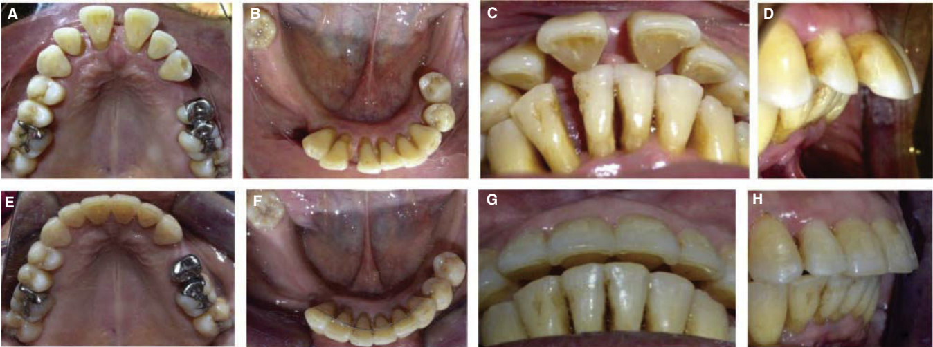
Figura 12. Fotografías comparativas iniciales (A, B, C, D) y finales (E, F, G, H).

realizar ciertos movimientos dentales que pueden ser favorables para un periodonto con enfermedad inactiva. 3