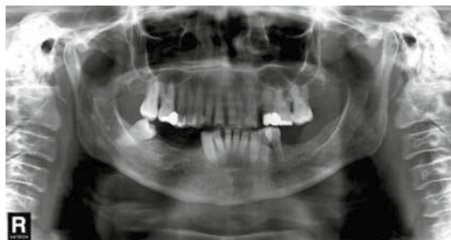
Figura 4. Radiografía panorámica inicial.

del paciente. Entre éstos se encuentran: mantener enfermedad periodontal inactiva, mejorar el perfil facial blando, reducir la protrusión y proinclinación superior e inferior, intruir dientes anteriores superiores, cerrar espacios interdientales, mejorar la sobremordida tanto vertical como horizontal y corregir rotaciones.