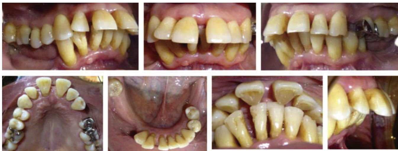
Figura 2. Fotografías intraorales iniciales.