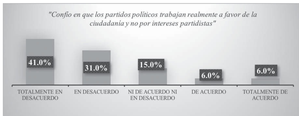
Gráfico 4. Confianza en el trabajo de los partidos políticos de Colima

Una de las respuestas más representativas del cuestionario fue cristalizada en un marcado consenso de desconfianza en el trabajo que realizan los distintos partidos. 42% dice estar totalmente en desacuerdo con la premisa de que los partidos políticos trabajan en favor de la ciudadanía y no por intereses partidistas. Posteriormente, en la misma línea de desaprobación, 31% menciona estar sólo en desacuerdo; 15%, ni de acuerdo ni en desacuerdo; en último término, las opciones de acuerdo y totalmente de acuerdo con el mismo planteamiento, ambas con 6% (véase Gráfico 4).