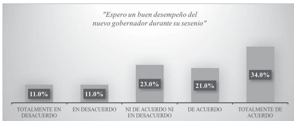
Gráfico 1. Esperanza en el trabajo del nuevo gobernador

El caso particular de la nueva administración del gobierno del estado de Colima representa un contexto lleno de contrastes. Respecto de la figura del nuevo gobernador, se observa una cierta esperanza ciudadana en él cuando una mayoría, representada por 34% del total, asegura estar totalmente de acuerdo con que espera un buen desempeño durante el sexenio que se inició recientemente. 23% considera posicionarse ni de acuerdo ni en desacuerdo con que lo logre, mientras que 21% afirma estar de acuerdo. En el último puesto, las opciones de totalmente en desacuerdo y en desacuerdo figuran con 11% (véase Gráfico 1).