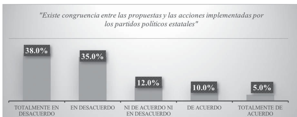
Gráfico 5. Conformidad en las acciones partidarias

En relación con la congruencia entre las propuestas de los partidos y las acciones implementadas por ellos, si los partidos demuestran congruencia entre las propuestas y las acciones implementadas, un 38% se posiciona en total desacuerdo con lo anterior, 35% afirma estar en desacuerdo, 12%, ni de acuerdo ni en desacuerdo, 10% de acuerdo y, finalmente, 5% está totalmente de acuerdo (véase Gráfico 5).