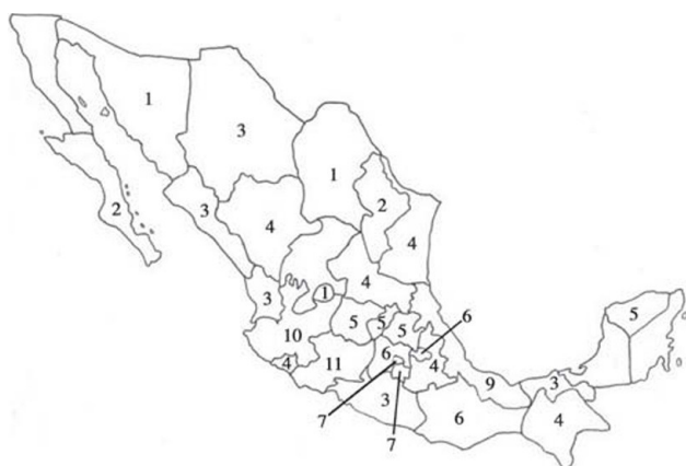
Figura 3. Riqueza específica de euhirudíneos por estado de la República Mexicana.

diagnosticables con base en caracteres morfológicos nos permite predecir que el número de especies por descubrir es relativamente alto, particularmente dentro de los géneros Helobdella , Erpobdella y Limnobdella , los cuales posiblemente contengan complejos de especies. Por otra parte, se evidencia el escaso conocimiento disponible sobre la distribución geográfica de los euhirudíneos en el territorio mexicano, existiendo amplias regiones geográficas sin ningún o escasos registros. El presente trabajo constituye, por lo tanto, un punto de partida para el diseño de proyectos de exploración y catalogación de euhirudíneos mexicanos.