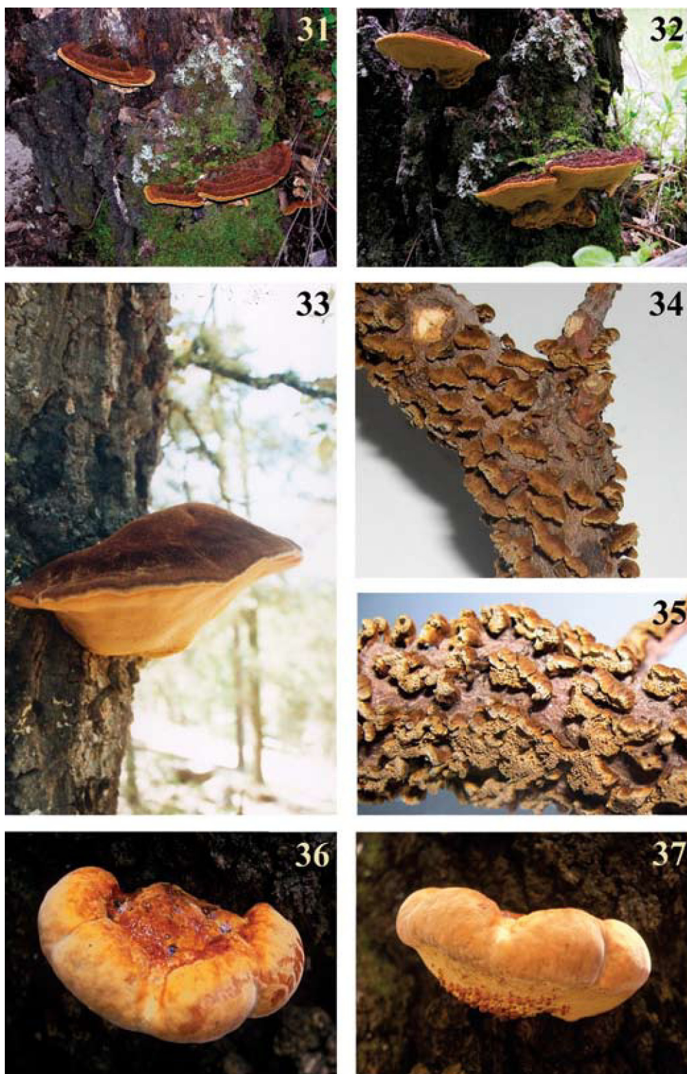
Figuras 31-37. Basidiomas. 31-32, Inonotus fulvomelleus : 31, superficie del píleo; 32, himenóforo. 33, Inonotus hispidus. 34-35, Inonotus pusillus : 34, superficie del píleo; 35, himenóforo. 36-37, Inonotus quercustris : 36, superficie del píleo. 37, himenóforo.