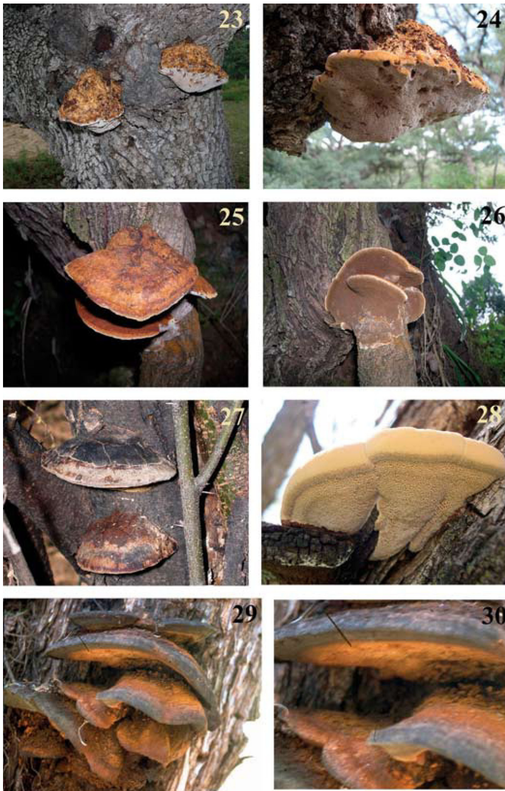
Figuras 23-30. Basidiomas. 23-24, Inocutis dryophila : 23, superficie del pileo. 24, himenóforo. 25-26, Inocutis jamaicensis : 25, superficie del pileo; 26, himenóforo. 27-28, Inocutis texana : 27, superficie del pileo; 28, himenóforo. 29-30, basidiomas de Inonotus cuticularis .