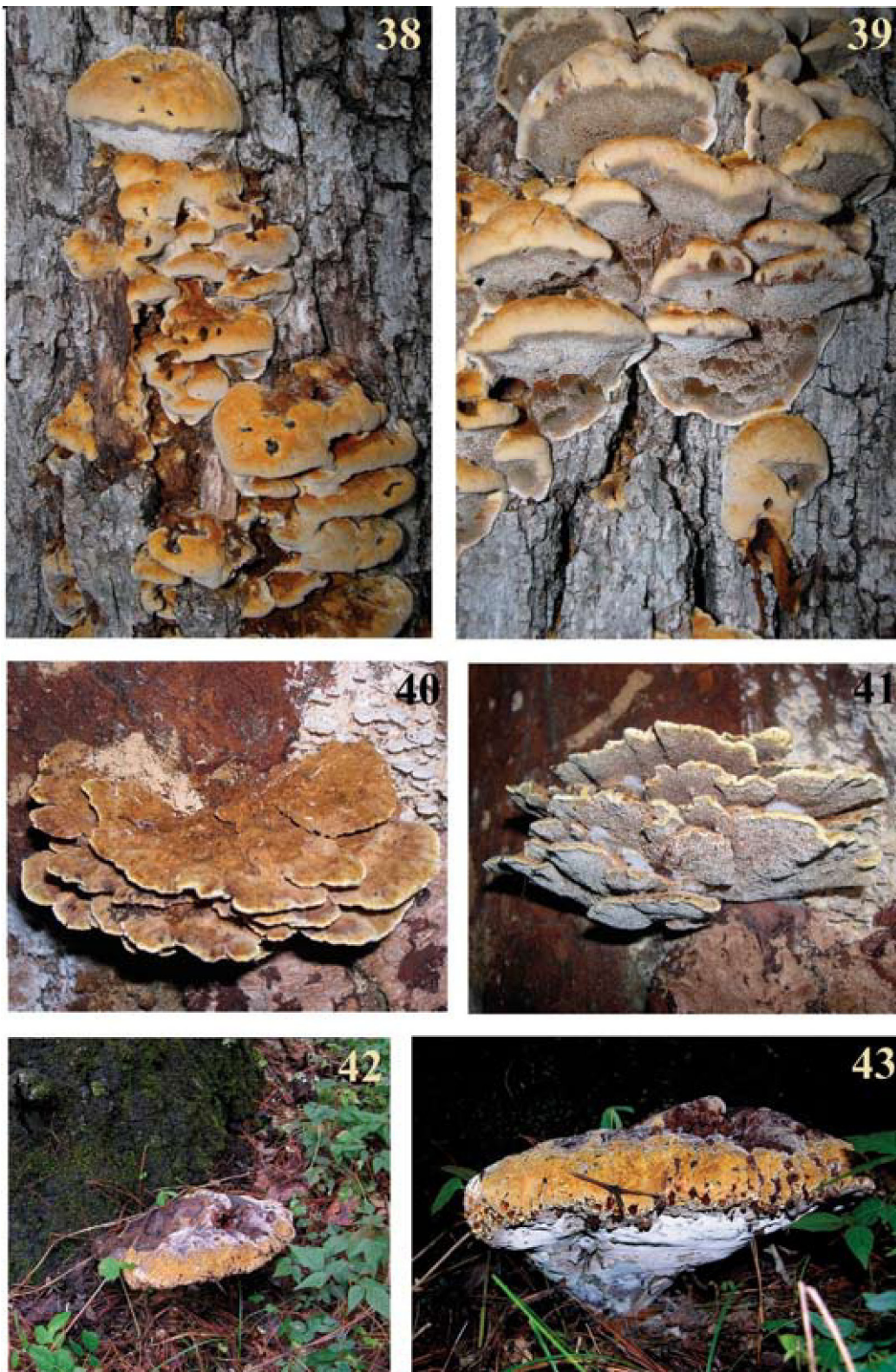
Figuras 38-43. Basidiomas. 38-39, Mensularia radiata : 38, superficie del pileo; 39, himenóforo. 40-41, Onnia circinata : 40, superficie del pileo; 41, himenóforo. 42-43, Pseudoinonotus dryadeus : 42, superficie del pileo; 43, himenóforo.