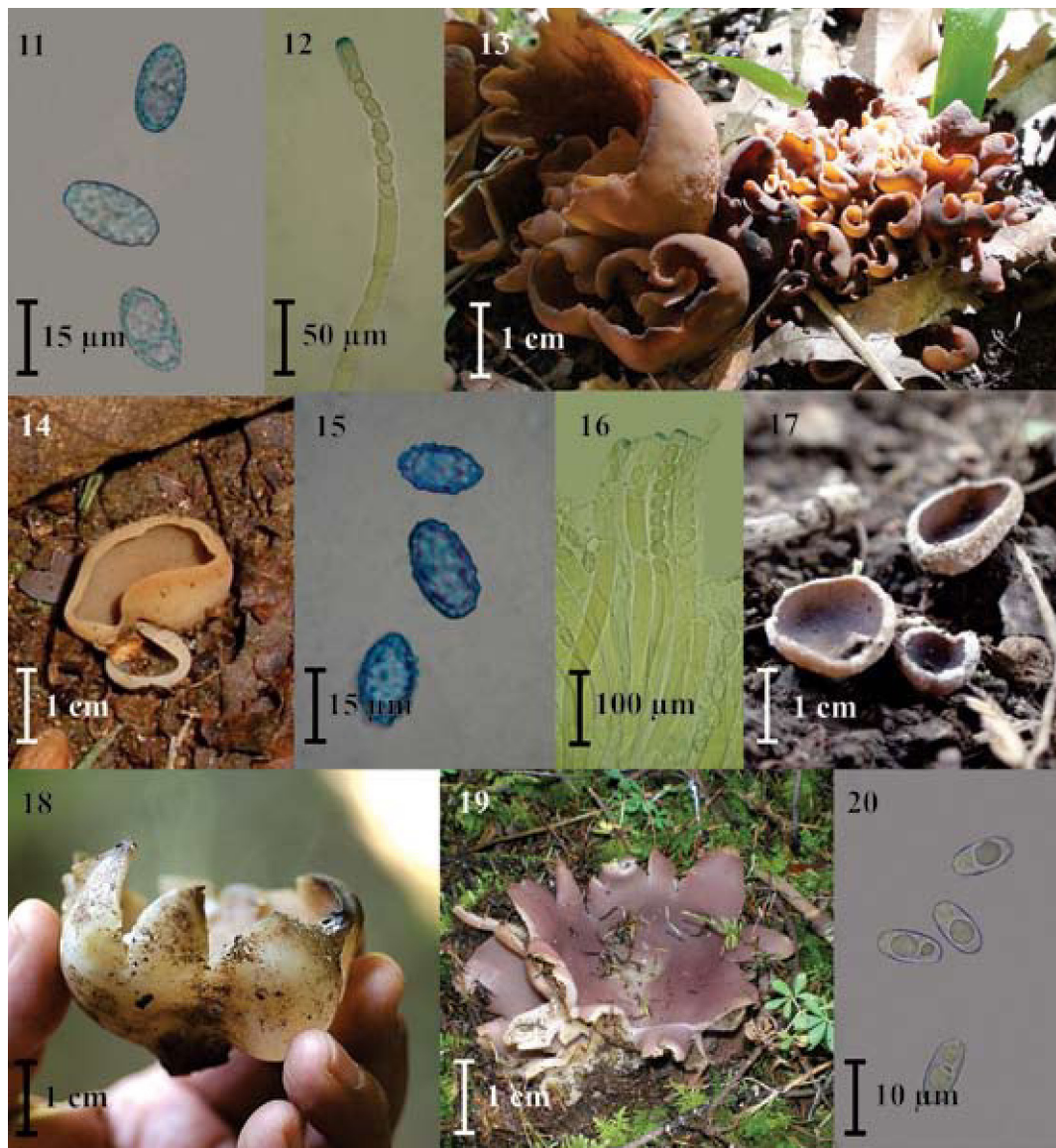
Figuras 11-20. 11-12, P. echinospora ; 11, ascosporas en azul de algodón; 12, asca amiloide. 13, P. repanda. 14-16: 14, P. succosella ; 15, ascosporas en azul de algodón; 16, ascas amiloides. 17, P. violacea. 18-20: Sarcosphaera coronaria ; 18, ascomas jóvenes ; 19, ascoma maduro ; 20, ascosporas vistas en KOH 5%.