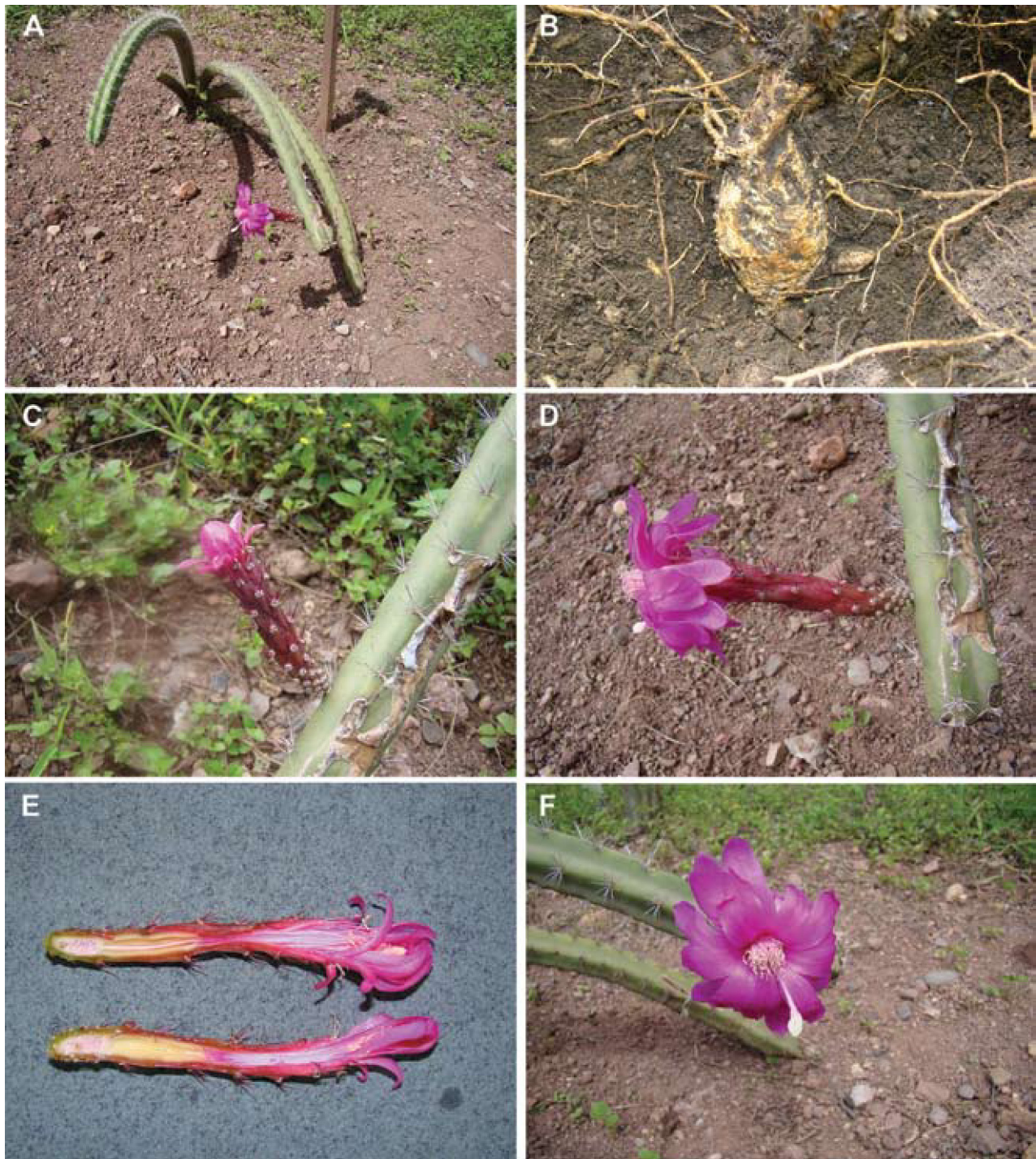
Figura 2. Peniocereus canoensis en cultivo (House et al. 5110). A, planta con flor; B, raíz tuberosa; C, botón floral; D, vista lateral de la flor; E, vista interna de la flor; F, vista frontal de la flor.

colores brillantes (rosa intenso o rojo), con el tubo largo y angosto, y una cámara nectarial bien diferenciada. Es importante mencionar, en este sentido, que las características