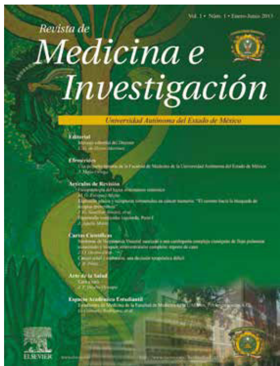
Figura 1 Revista Medicina e Investigación.

Nosotros en la Facultad de Medicina de la UAEMex, seguimos la corriente hipocrática cuya historia y enseñanza de la medicina provienen de Hipócrates de Cos 4 , quien algunos consideran “Padre de la medicina clínica”, y cuyo juramento persiste hasta nuestros días, cuando obtenemos el título de Médicos. Con su visión vanguardista, Hipócrates fundó la llamada escuela “hipocrática” que evolucionó la medicina de la antigua Grecia, y que perdura en muchos conceptos hasta nuestros días. Donde resalta en su práctica médica: honestidad, comprensión, sobriedad y limpieza. Quién además consideró de vital importancia al método científico de la observación, y posterior documentación de los hallazgos. Esto nos hizo pensar en un color para la portada de la RevMedInv, ¿qué color, tipo de imágenes? En fin, ardua tarea, en esta parte qué decir con respecto al crear una revista electrónica.