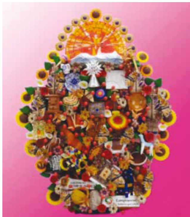
Figura 2 Árbol de la vida, Metepec, Méx., México.

Columna es un término habitual en el ámbito de la arquitectura, ya que se trata del soporte vertical que permite sostener el peso de una estructura. El concepto también se utiliza para nombrar a un monumento conmemorativo, a la persona o cosa que sirve de apoyo y a la formación militar que marcha de manera ordenada. Consideramos como símbolo algo que identifica a nuestro Estado de México a nivel mundial, es el “árbol de la vida” (fig. 2), que ilustra la idea de la vida en la tierra, se ha utilizado en la ciencia, la religión, la filosofía, la mitología y en otras áreas. El árbol de la vida tallado, pintado, bordado o impreso ha existido desde el comienzo de la historia, y de una manera esta columna con ramas trata de representar el mismo, cuyo significado es misterioso, esconde el cómo caminar por los senderos de la vida con satisfacción en la medida que se establezca coherencia en la relación de sus estructuras, se permite que lo que se origina en sus ramas se refleje fielmente en el plan material. Asumimos también que sería similar al báculo o bastón de Esculapio. La serpiente ha representado a lo largo de la historia de la humanidad un sinnúmero de simbolismos que hacen a la vida espiritual del hombre, apareciendo muchas veces como aspecto maléfico en determinados mitos y