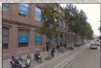
12. IL3. Universidad de Barcelona Máster Homeopatía desde 1995. UB y AMHB. C/. Ciutat de Granada, 131. Barcelona.