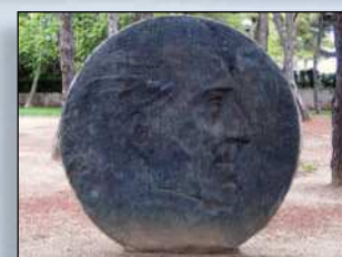
10. Monumento a Hahnemann en Barcelona Iniciativa: Academia Medico Homeopática de Barcelona, en 1990, por su Centenario (1890-1990). Coincidiendo con el Congreso Internacional de la Liga MHI, celebrado en Barcelona. Avda. de Sarrià esquina calle Dr. Fleming (Jardines cerca de la Diagonal)