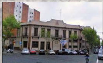
14. Hospital Homeopático del Nen Déu Desde 1923. Fundación benéfica. Consultorios de Homeopatía. C/. Mallorca, 509. Barcelona. Traslado al Pº Margall.