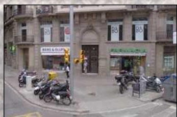
8. Farmacia Coliseum y Libreria Coliseum Producción propia y Librería Homeopática C/. Balmes, 18. 08007 Barcelona.