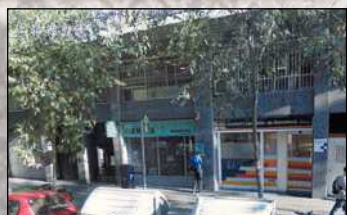
7. Farmacia Cercavins Miembro de AEFH Farmacia homeopática desde 1843. C/. Casp, 146. 08013 Barcelona (antes del 1994 en C/. Unió)