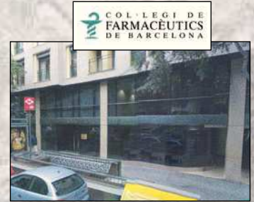
4. Colegio Oficial de Farmacéuticos de Barcelona Cursos de Homeopatía para Farmacéuticos C/. Girona, 64. 08009 Barcelona