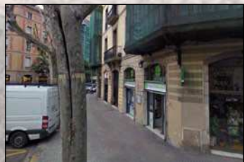
5. Farmacia Miserachs Miembro de AEFH Farmacia homeopática desde finales del siglo XIX. C/. Roger de Llúria, 51. 08009 Barcelona