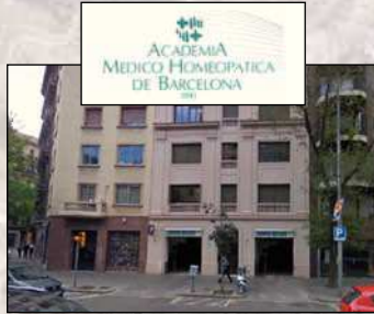
2. Academia Médico Homeopática de Barcelona Fundada en 1890. C/. Aragó, 186, 2n. 08011 Barcelona