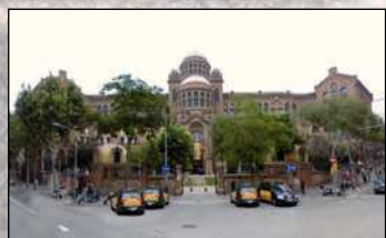
13. Casa de Convalecència. Hospital de Sant Pau Cursos de postgrado del CEDH. C/. Sant Antoni Maria Claret, 171. Barcelona.