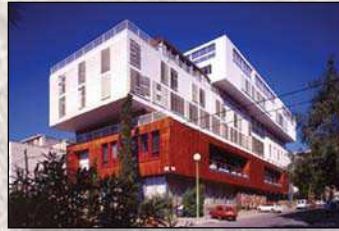
3. Sección colegial de Homeopatía Colegio Oficial de Médicos de Barcelona Pº Bonanova, 47. 08017 Barcelona