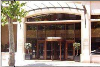
1. Hotel Gallery Sede del IV Congreso Nacional de Homeopatía C/. Rosselló, 249. Barcelona.