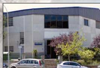
9. Laboratorios Boiron España Delegación Barcelona C/. Durán i Jordá, s/n - Nave 3 08960 Sant Just Desvern