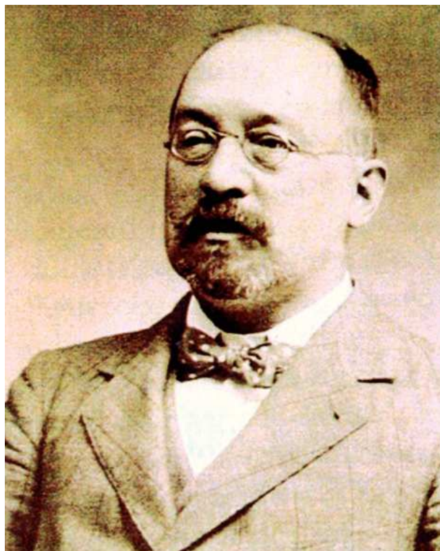
Figura 8 Modest Furest i Roca (San Pol de Mar, 1852-Calella de la Costa,

Acabada la Guerra se exilió con su familia a la ciudad colombiana de Barranquilla, donde ejerció la medicina al tiempo que estudia botánica. Poco después accedió a la cátedra de Botánica de la Escuela de Farmacia de la