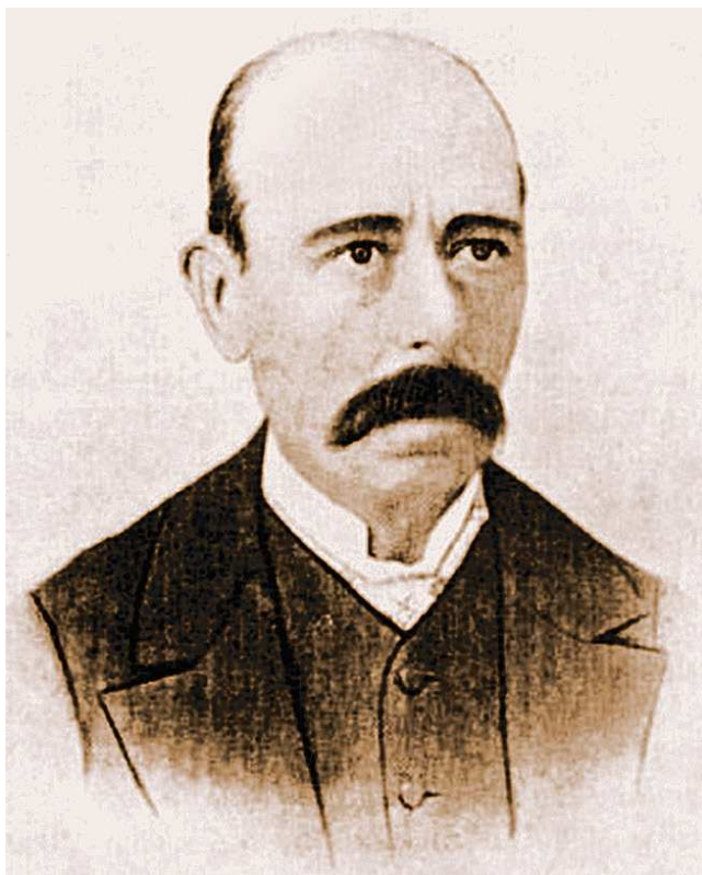
Figura 4 Salvi Almató i Ribera (Olesa de Montserrat, 1827-Barcelona, 1889).

Por su dedicación al tratamiento homeopático de enfermos infectados en la epidemia de cólera que hubo en Barcelona en 1865 y en la de la fiebre amarilla de 1870, Salvi Almató i Ribera fue distinguido con la Medalla de Plata del Ayuntamiento de Barcelona.