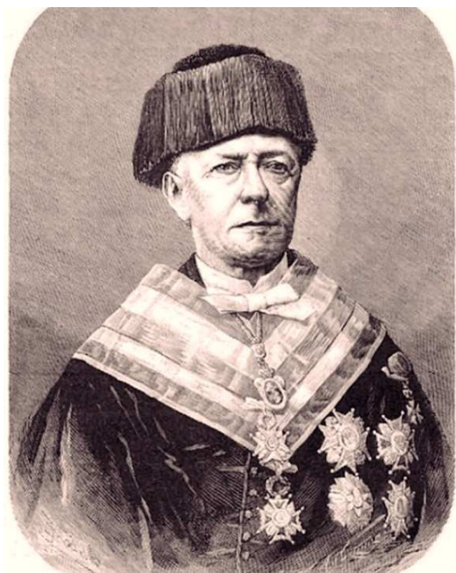
Figura 2 Joaquim Hysern i Molleras (Banyoles, 1804-Madrid, 1883).

Joaquim Hysern i Molleras (Banyoles) fue otro personaje con grandes capacidades 2 . En el año 1828 fue nombrado profesor adjunto del Real Colegio de Cirugía de Barcelona y en 1830 obtuvo la cátedra de Anatomía. Unos años después, cuando obtuvo el nombramiento de catedrático del Real Colegio de Cirugía de Madrid, marchó a Madrid. Allí introdujo un notable cambio en la docencia; abandonó las lecciones magistrales e inició la enseñanza práctica, en la que llegó a incluir prácticas de vivisección con sus alumnos.