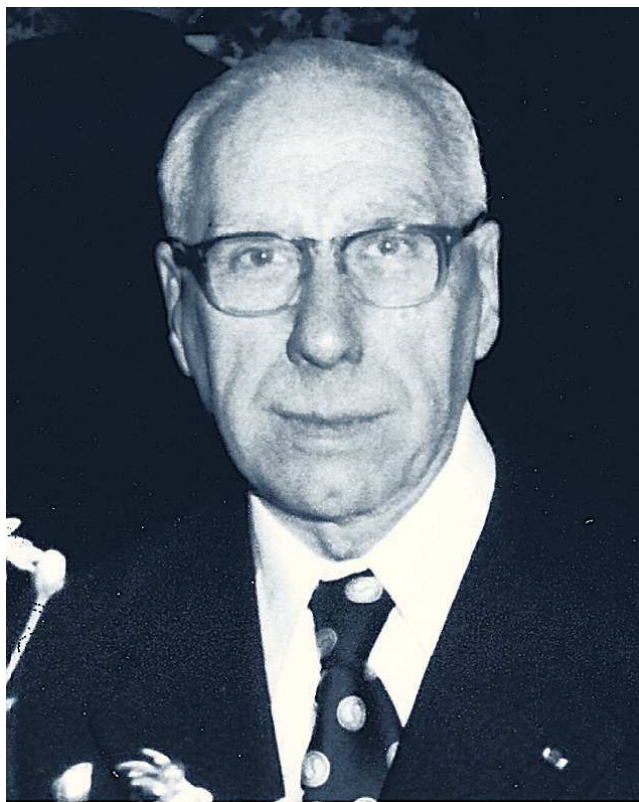
Figura 5 Enric Peiró i Rando (Barcelona, 1899-Lleida, 1985).

Otro homeópata destacado fue Joan Solé i Pla (fig. 7), muy interesado por la política y el catalanismo 4 . Militó en el republicanismo federal y fue miembro del Centro Escolar Catalanista, adherido a Unión Catalanista (UC) dónde ingresó convencido por Domènec Martí i Julià. Fue presidente de UC en el bienio de 1900-1901. Asimismo,