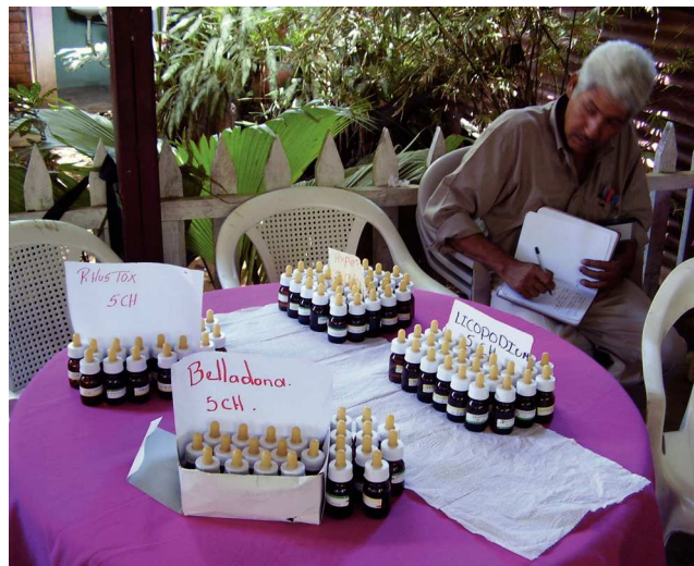
Figura 4 Remedios elaborados.

El Centro SomoSalud aporta, además, un espacio donde los promotores pueden ejercer, haciéndoles sentirse útiles