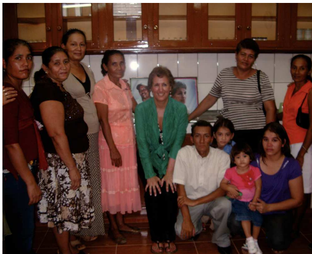
Figura 3 Grupo de promotores.

fundamental, como también el conocimiento de la homeopatía.