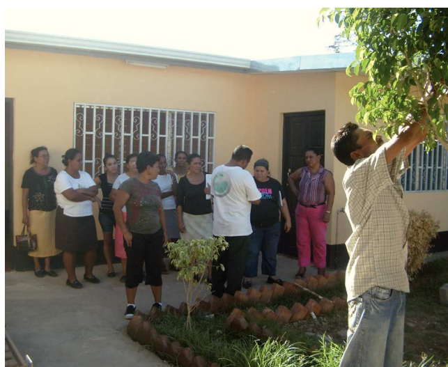
Figura 1 Promotores ante el centro de salud Somosalud.

Poder limpiar una herida, contener una hemorragia, inmovilizar una fractura, tratar una quemadura o curar llagas son tareas que puede facilitar un promotor de salud preparado en la atención a los primeros auxilios. Pensamos, además, que la recuperación del uso de las plantas medicinales, sorprendentemente olvidado y tan necesario en un país donde no hay medicamentos, era