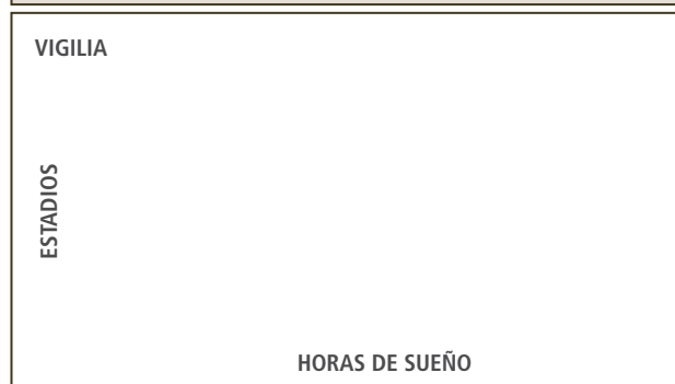
Figura 2: Durante el sueño presentamos varios ciclos de sueño que incluyen sueño NREM y REM. El sueño se inicia con sueño NREM estadio 1 y se profundiza hasta el estadio 4 pasando luego a estadios más superficiales y a REM. Los periodos de sueño en estadio 3 y 4 (profundos) son más largos en la primera parte de la noche. El sueño REM (experiencias oníricas) es más de la segunda mitad y del amanecer. Durante la noche también alcanzamos el estadio de vigilia por momentos, especialmente en la segunda mitad de la noche.