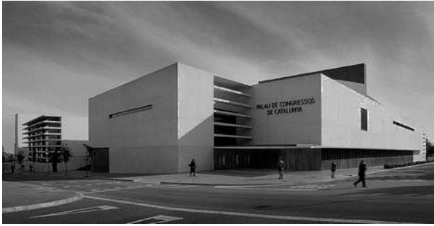
Palacio Congresos, sede de los congresos de Barcelona.

tablemente es imposible citar a todos, pero es imposible no citar a los Dres. Puigvert, Pomerol, Mancini, Morell, Bayo, Moreira, Egozcue y Caballero, sólo por citar algunos cuya huella ha sido y es inolvidable.