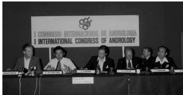
I Congreso Internacional de Andrología. Barcelona, 1976.