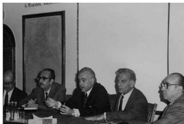
II International Course on Male Infertility.