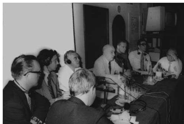
I International Course on Male Infertility.