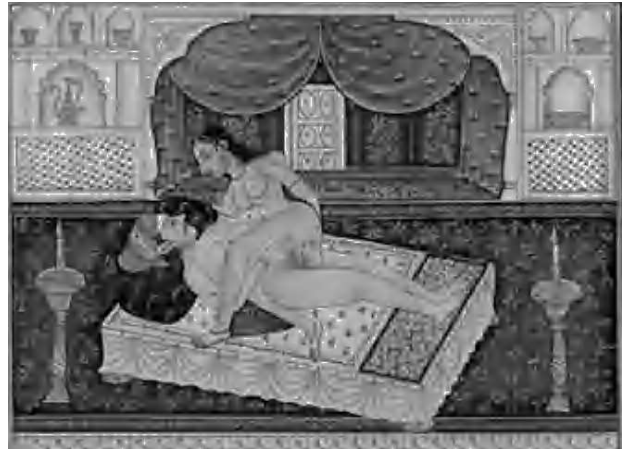
Figura 2. Ilustración del Kamasutra, obra antigua más importante y conocida acerca del sexo y la sexualidad, escrita por Vatsyana Mallanaga entre los años 340 y 540 d.C. Tomada de Sir Richard Francis Burton 3 .

Dentro del mundo asiático, el sexo tántrico , cuyo origen se encuentra en el Tíbet, introduce un nuevo concepto que es el de los genitales y la sexualidad de la mujer y la compenetración entre ambos géneros, pero una vez más nos encontramos que va ligado a la religiosidad y a la forma de vida 4 .