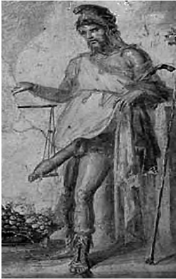
Figura 1. Priapo, el dios de la fecundidad de la mitología clásica, en el vestíbulo de la Casa de los Vitti en Pompeya. Tomado de Clarke 2 .

Vatsyana Mallanaga entre los años 340 y 540 d.C. La sutileza, el detalle y la información acerca de la sexualidad hacen de este escrito el más importante en su género para todas las épocas y culturas. Curiosamente, de entre la mayoría de capítulos dedicados a la sexualidad y descripción de la práctica del sexo y sus variantes (fig. 2), nos encontramos con un libretto adjunto al Kamasutra en el cual se describe al varón según el tamaño del pene, también relacionándolo a su morfología y a la pareja que le corresponde. Éste sería un claro caso en el que el tamaño peneano pasa a segundo lugar y solamente tiene valor según su aspecto externo y su relación directa a la actividad sexual 3 .