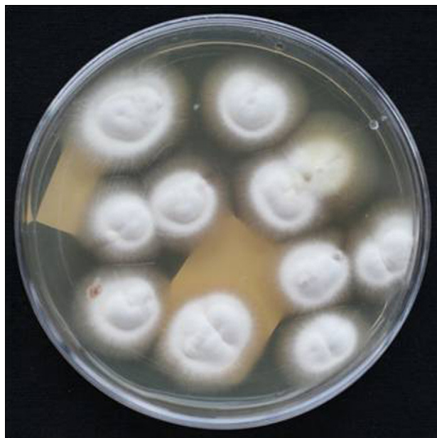
Figura 3. Cultivo: crecimiento de colonias de T. rubrum a los 20 días de incubación. Agar glucosado de Sabouraud.