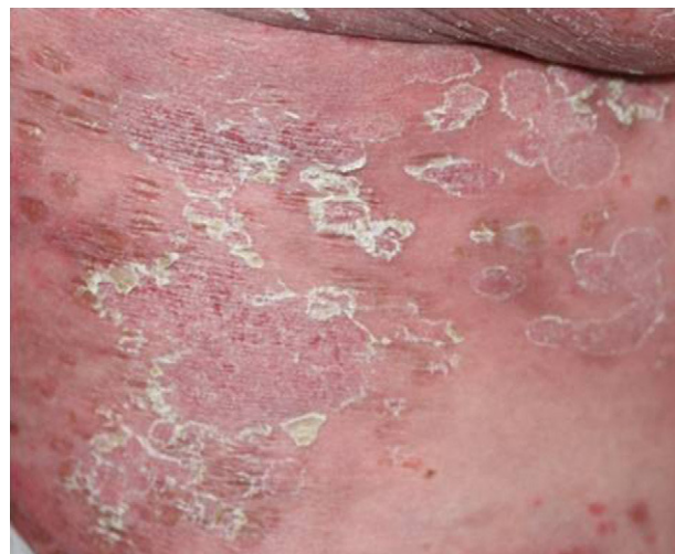
Figura 1. Aspecto inicial de las lesiones: placas eritematoescamosas en los muslos.

En el caso que se presenta, el compromiso de la región glútea y de los muslos permite suponer que el foco de origen de la tiña sería la región inguinal o las uñas de los pies, dos de los principales sitios mencionados como reservorios en otros estudios 1,14 . Durante los últimos años se han descrito casos por T. rubrum var. raubitschekii como agente etiológico con predilección por el área crural y extensión a los glúteos 4 .