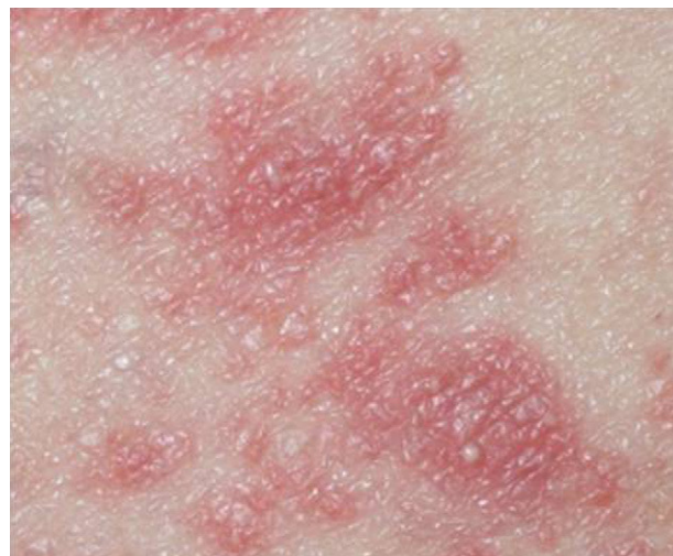
Figura 2. Pústulas en el abdomen.