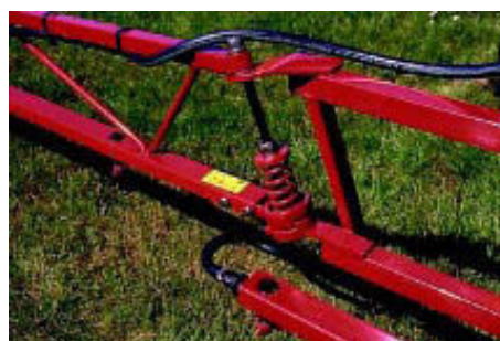
Figura 1. Detalle de una sección de la barra de aplicación de tratamientos

La barra de tratamiento es una HARDI NK, de 10 metros de longitud, con 5 secciones con control de apertura y cierre independiente de 2 metros cada una. El equipo consta además de un depósito de 400 litros, de una bomba que lleva el líquido hasta los brazos de pulverización y de sensores que permiten determinar el estado del equipo en cada instante (presión de trabajo, caudal, secciones abiertas, etc.). El control de apertura y cierre es simultáneo de modo que en el mismo instante pueden estar abiertas varias secciones de la barra mientras el resto permanecen cerradas. Es importante resaltar que, en una situación como la descrita, todas las secciones abiertas tendrán el mismo caudal. En la figura 1 se muestra una de las secciones de la barra de aplicación de tratamientos y en la figura 2 se muestra un esquema de operación del equipo. La actuación sobre el caudal en la etapa de integración del controlador propuesto se realizará utilizando el sistema de ajuste del volumen del líquido (punto 8 en el diagrama) que suministra el propio fabricante.