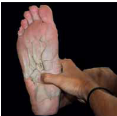
Figura 6: Manipulación del cuboides según Dananberg.

Colocaremos el pulgar de la mano izquierda sobre la cara inferomedial del cuboides y el resto de los dedos se deslizan sobre la garganta del astrágalo para situarse sobre el dorso del pie (figura 6).