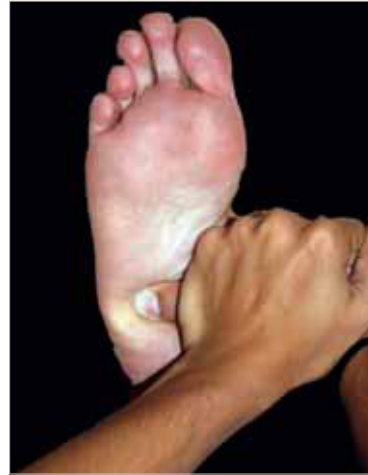
Figura 7: Manipulación del cuboides según Dananberg.

Posteriormente, la eminencia hipotenar de la mano derecha se colocará sobre el pulgar de la mano izquierda. Con las manos situadas correctamente sobre la planta del pie, se realiza un empuje rápido y de fuerza moderada contra el cuboides. Hay que tener sumo cuidado de no efectuar una fuerza excesiva sobre la superficie inferior del cuboides ya que puede estar sensible debido a la restricción de movimiento. Es raro observar sonido audible realizados por esta técnica (figura 7).