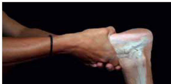
Figura 4: Manipulación del cuboides; maniobra de Snap.

Esta técnica (descrita para el pie izquierdo) se realiza con el paciente de cubito prono sobre la camilla y nosotros nos situaremos en el extremo de la camilla. Llevaremos la rodilla del paciente en flexión de 90° y con el tobillo relajado en posición neutra, de este modo se reduce la tensión de los gemelos y evitamos el estiramiento del nervio peroneo superficial para no dañarlo 13, 18, 19, 20, 21 (figura 4).