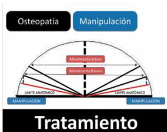
Figura 3. Tratamiento manipulativo.

La Osteopatía se basa en que todos los sistemas del cuerpo trabajan conjuntamente y están relacionados, por tanto los trastornos en un sistema pueden afectar el funcionamiento del resto. El tratamiento que se denomina manipulación osteopática (figura 3) consiste en un sistema de técnicas prácticas (manipulaciones articulares, técnicas de energía muscular, de movilización) orientadas a aliviar el dolor y restaurar funciones.