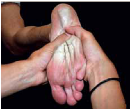
Figura 5: Manipulación del cuboides; maniobra de Snap.

Colocaremos el pulgar de la mano derecha, sobre la cara plantar medial del cuboides, el pulgar de la mano izquierda sobre el pulgar derecho para reforzar la acción prensil y los dedos entrelazados sobre el dorso del pie. Tendremos cuidado de no poner los dedos directamente sobre el cuboides en la parte dorsal, ya que puede impedir el desbloqueo óseo 21 . Una vez situadas las manos correctamente sobre el pie del paciente, pasaremos a realizar movimientos circulares de la pierna buscando los límites del movimiento pasivo del paciente (conseguiremos conocer el punto exacto de manipulación y obtendremos relajación de la musculatura a tratar). Posteriormente se extiende la rodilla del paciente a la vez que se presiona el cuboides en su cara plantar medial con los pulgares y se plantaflexiona el tobillo con una ligera supinación de la articulación subastragalina 13, 19 (figura 5).