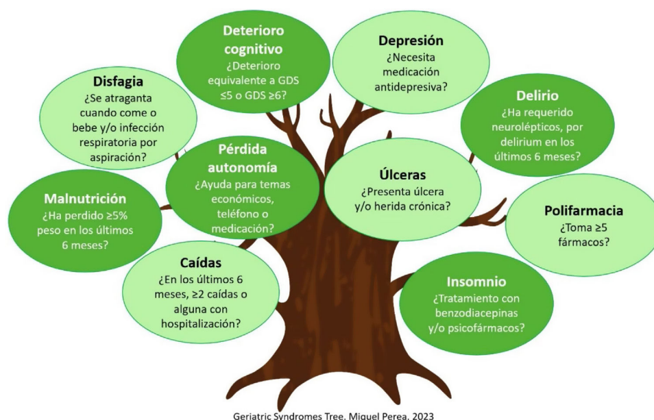
Figura 1. Preguntas «trigger» incluidas en el índice IF-VIG para discriminar los síndromes geriátricos.

y a los 30 días del alta (IF-VIG 3 ). La metodología de recogida de información se describe con más detalle en el artículo de Torné et al. 19 .