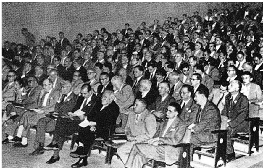
Figura 4 Asistencia en una de las salas del Congreso SICOT en Barcelona en 1957.

Con unos ponentes de primer nivel que abarcan todos los continentes, SICOT SOWC 2025 promete ser un encuentro verdaderamente global donde expertos y líderes emergentes se reunirán para compartir sus investigaciones, debatir los desafíos clave y definir el futuro de la ortopedia. Las sesiones científicas se han organizado cuidadosamente para garantizar un equilibrio entre investigación de vanguardia, aprendizaje práctico y debates que invitan a la reflexión e inspirarán avances significativos en la atención al paciente.