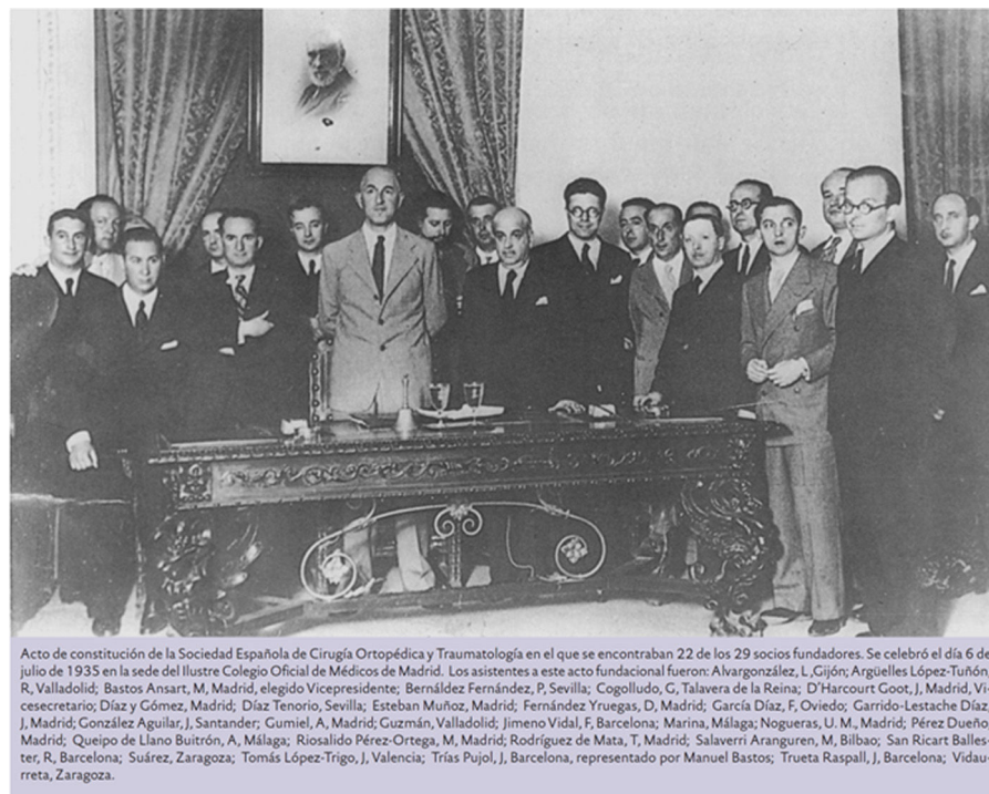
Figura 2 Fundación de la Sociedad Española de Cirugía Ortopédica, 6 de julio de 1935.