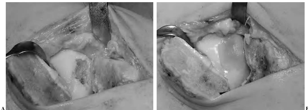
Figura 4. (A) Abordaje transmaleolar de una lesión osteocondral medial con quiste subcondral. (B) Imagen de implante de condrocitos autólogos cultivados (MACI).

nes existentes para su aplicación. Debe tratarse de un defecto focal, continente, mayor de 2 cm, con un buen lecho subcondral, en pacientes menores de 50 años y sin signos de artrosis ni lesiones condrales en espejo, en tobillos estables y normoalineados. Para muchos autores esta técnica debería estar reservada para situaciones de fracaso de cirugía previa y/o existencia de un gran defecto subcondral.