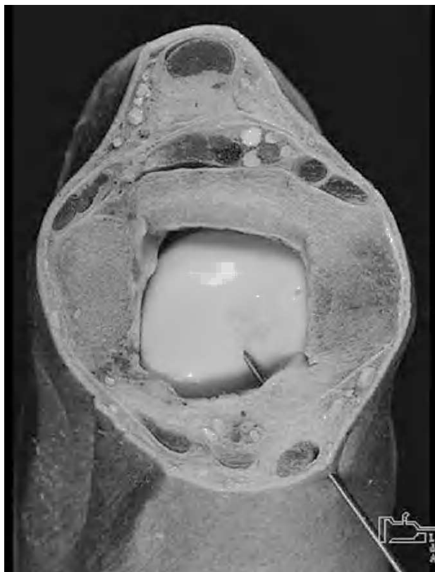
Figura 1. Imagen anatómica del abordaje anterointerno.

sistemática de la técnica que permita ese «ambiente estable» que nos prepare para la compleja y exigente cirugía condral, ya que la morfología articular dificulta el acceso y las posibilidades del tratamiento lesional.