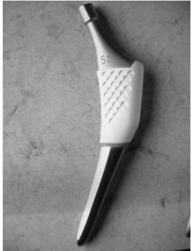
Figura 1. Vástago ABG-II ® que muestra la zona metafisaria con recubrimiento de hidroxiapatita y la cola, pulida, delgada y breve.

Se inició el estudio con un total de 70 pacientes, completándose el seguimiento a 3 años en 69 (30 hombres y 39 mujeres), con una edad media de 59 años (38 a 76) y un peso de 79,3 kg (49 a 110 kg). Al final del seguimiento se había perdido un paciente por enfermedad neurológica grave que no le permitía la deambulación. Los criterios de inclusión fueron: tener indicación quirúrgica para este tipo de implantes, afectación unilateral, ya que la cadera contralateral sana se utilizó como control, y la aceptación a participar en el estudio mediante la firma de un documento de consentimiento informado. El Comité local de Ética en la Investi-