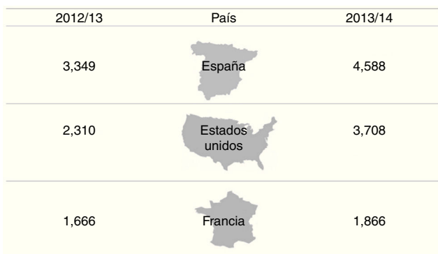
Figura 3. Países de destino de los estudiantes mexicanos.