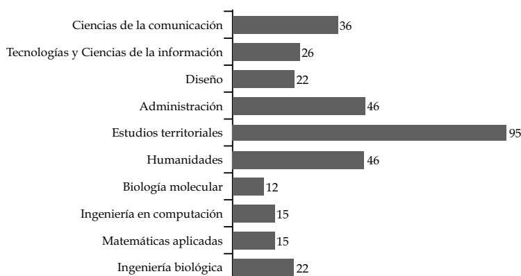
Gráfica 2 Total de temas relacionados directa o parcialmente con la sustentabilidad contenidos en los Planes de Estudio de la UAM-C