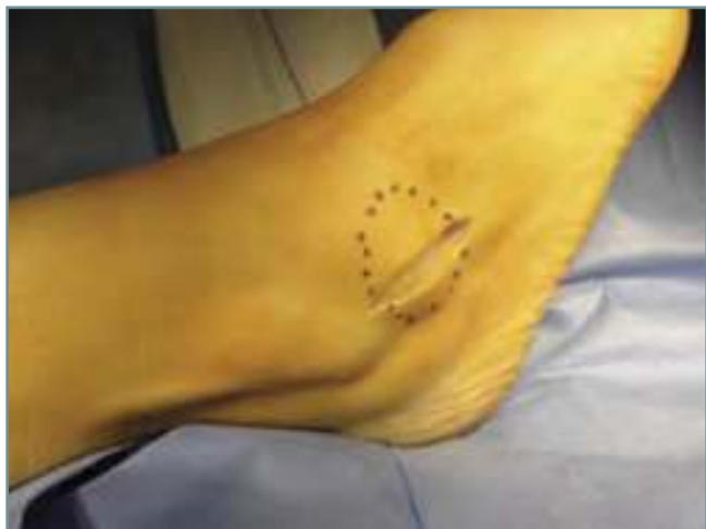
Figura 1. Aspecto macroscópico prequirúrgico de la lesión.

Figure 1. Macroscopic presurgical aspect of the lesion (dotted contour).