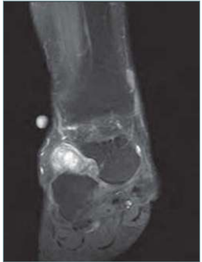
Figura 6. Imagen de RNM en la que se aprecia el lugar en el que creemos que el tumor pasó de la región medial a la lateral.

Kotwall et al. aplicaron radioterapia a un grupo de pacientes posterior a la extirpación y observaron una disminución en las recurrencias hasta de un 4% después de un seguimiento durante 52 meses. Recomiendan esta alternativa en los pacientes en quienes la extirpación completa no es posible. La recurrencia no tiene relación con la edad, el sexo, el tamaño ni la localización.