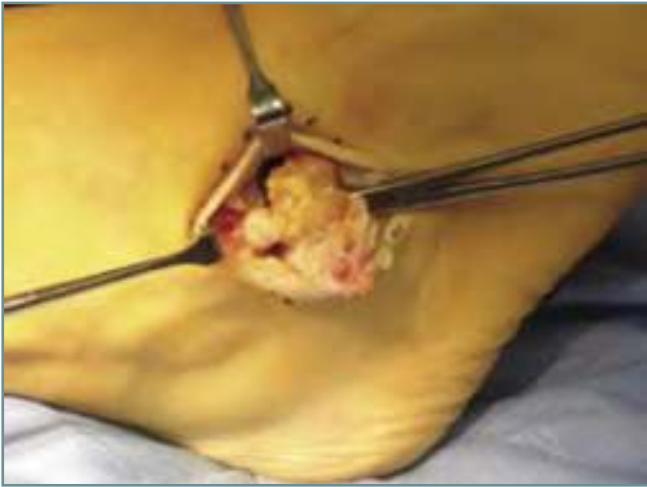
Figura 5. Imagen quirúrgica tras penetrar en el seno del tarso y aparición de la lesión tumoral.

Figure 5. The surgical field after entering the tarsal sinus with exposure of the tumoral lesion.