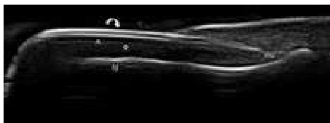
Figura 2. Representación ultrasonográfica de la uña normal en corte longitudinal, obtenida utilizando un equipo MyLab 70 XVG US con sonda linear de 6-18 MHz. El plato dorsal (flecha curva) y el ventral (cabeza de flecha) aparecen como una estructura trilaminar conformada por dos líneas hiperecogénicas separadas por una banda fina hipoanecogénica. El lecho ungüeal (círculo) se muestra hipoanecoico, difícilmente distinguible del tejido celular sub-cutáneo adyacente. mu= matriz ungüeal; fd = falange distal.