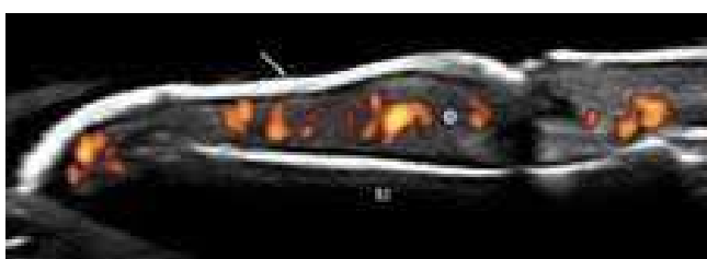
Figura 4. Imagen ultrasonográfica de onicopatía psoriásica en corte longitudinal. Se evidencia la pérdida de la típica conformación trilaminar de los platos ungüesales que aparecen fusionados y no homogéneamente engrosados (flecha). El lecho ungüeal está claramente aumentado de espesor (círculo) y el power Doppler revela una marcada señal indicativa de un aumento de la perfusión sanguínea. La imagen fue obtenida usando un equipo MyLab 70 XVG US con transductor linear de 6-18 MHz y frecuencia Doppler de 9.1 MHz. fd = falange distal.

can en la uña psoriásica. Los platos ungüesales se caracterizan por la pérdida de la homogeneidad y de la trilaminaridad, apareciendo engrosados y fusionados. El lecho ungüeal se muestra usualmente engrosado con un grado variable de flujo sanguíneo, detectable mediante la técnica PD (Figura 4).