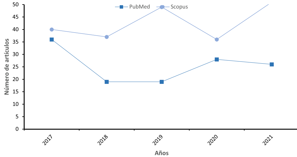
Figura 1 – Artículos publicados en PubMed y Scopus por año.