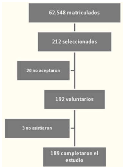
Figura 3. Esquema del estudio

\pm 0,09 , en hombres 1,63 \pm 0,11 , y 1,58 \pm 0,07 m en mujeres.