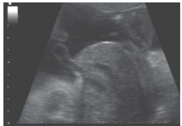
Figura 2. Onfalocele con contenido hepático en su interior.