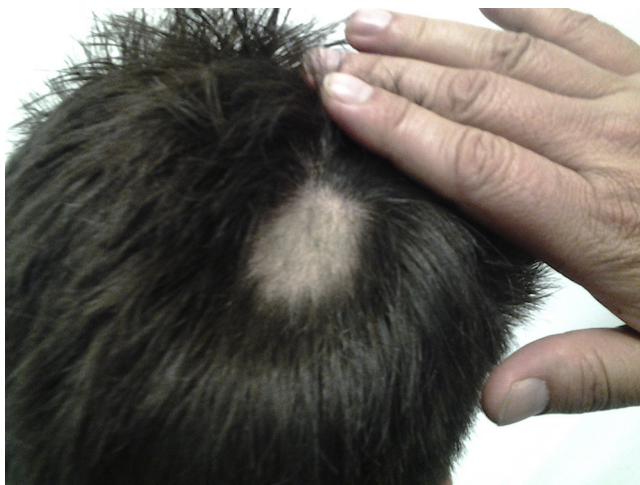
Figura 2 – Zona de alopecia a las 12 semanas posoperatorias. Signos de repilación y disminución de área.

foliculos en fase catagénica. No hubo necrosis de células del bulbo piloso, en contraste con los hallazgos de Abel y Lewis. Tampoco reportó vasculitis.