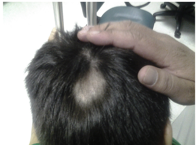
Figura 1 – Zona de alopecia a las 4 semanas posoperatorias. Signos de repilación.

Boyer y Vidmar identificaron AP en un hombre de 79 años, sometido a cirugía de arterias coronarias 6 . La biopsia del cuero cabelludo 4 semanas después de la cirugía mostró fibrosis e inflamación en la dermis reticular superficial asociada a