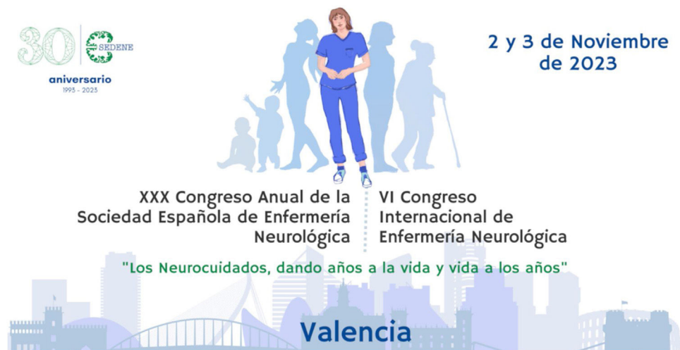
Figura 1 Ilustración del lema para el XXX Congreso Anual y VI Congreso Internacional de la SEDENE «Los neurocuidados: dando años a la vida y vida a los años».