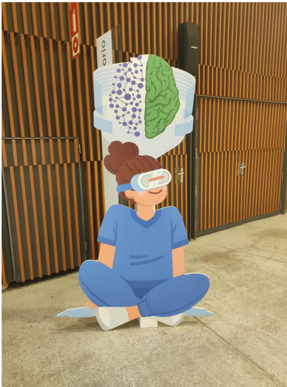
Figura 1 Logo congreso ilustrativo del lema «Metacuidado: un nuevo entorno enfermero».

todos ellos dedicados a temas de aplicación en la práctica clínica. Este año se han ampliado los grupos de estudio y, por ende, los talleres precongresuales, por lo que algunos se organizaron de forma conjunta.