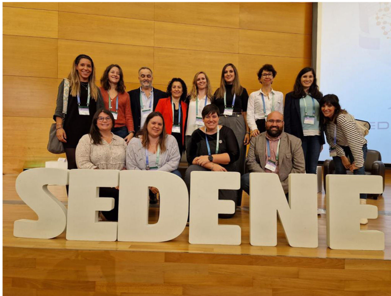
Figura 2 Algunos miembros de la Junta Directiva con el hashtag del congreso.