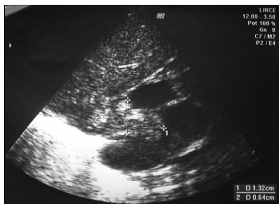
Figura 2. Ecocardiografía: A los 14 días de vida se observa foramen oval permeable, trombo en vena cava inferior y en aurícula derecha (AD) que pasa por el foramen oval hacia la aurícula izquierda (AI), con alto riesgo de embolizar. Trombo en vena cava inferior, AD que pasa por el foramen oval hacia la AI (13,2*6,4 mm).