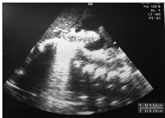
Figura 1. Ecocardiografía: A los 10 días de vida, visión subcostal que demuestra trombo de 15 mm por 2,8 mm que se extiende desde la vena cava inferior hasta la entrada de AD. Trombo en vena cava inferior y entrada de AD. 15*2,8 mm sin otros hallazgos. (AD: aurícula derecha).

Se realizó al mes de vida ecocardiografía de control, destacando disminución del tamaño del trombo (figura 3), con hemocultivos de