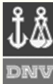
DNV España (Der Norske Veritas)