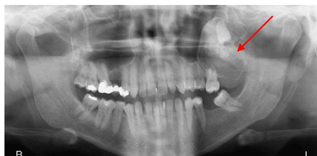
Figura 1 Ortopantomografía.

Disponible en Internet el 8 de noviembre de 2011