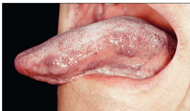
Figura 1. Tumefacción de la lengua, sobre todo en los bordes.