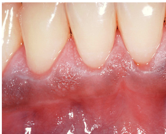
Figura 1. Pigmentación pardusca difusa.