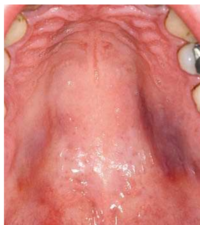
Figura 2. Pigmentaciones de color azulado-violáceo-rojizo en el paladar.