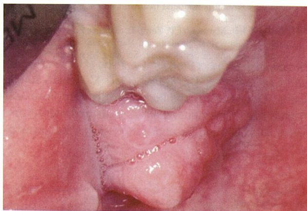
Figura 1. Tumefacción en la zona de la tuberosidad maxilar que causa dolor leve.