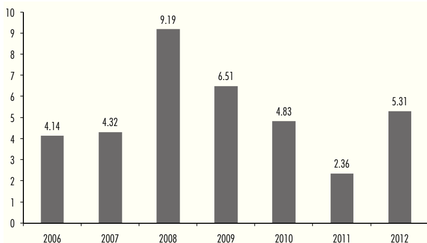
Gráfica 3. Déficit presupuestal (Porcentaje del PIB)