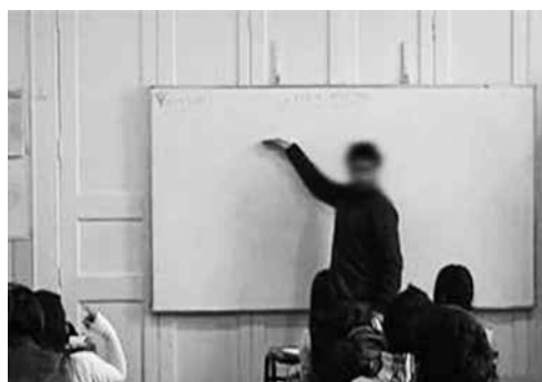
Figura 2. Ejemplo de género procedimental

detallando mediante habla y gestos cómo se construirá e interpretará el modo semiótico, sea un mapa, una tabla de doble entrada o un listado. La tercera etapa (3) de este género no siempre está presente y tiene que ver con la explicitación de cómo se piensa en la disciplina, a través de un ejercicio metahistórico que le da sentido a la actividad que viene a continuación.