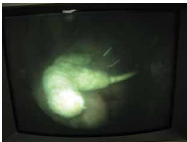
FIGURA 3. Caso 1. Cistoscopia, donde se observa DIU calcificado intravesical.