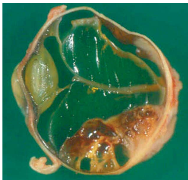
FIGURA 3. Pieza de enucleación ocular de 2,5 cm de diámetro máximo. Al corte presenta una zona retiniana desprendida y ocupada por una tumoración de 1,5 x 0,7 cm de dimensiones máximas y con áreas de aspecto hemático. El examen microscópico observó un carcinoma renal de células claras con desprendimiento de retina secundario.